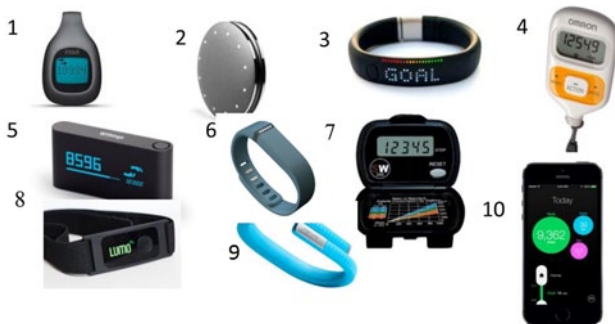
Figuur 1 Tien activity trackers die werden getoetst op hun accuratesse. 1 Fitbit Zip, 2 Misfit Shine, 3 Nike + Fuelband, 4 Omron Walking style III, 5 Withings Pulse, 6 Fitbit Flex, 7 Digiwalker SW-200, 8 Lumoback, 9 Jawbone Up, 10 Moves app.

Uit de resultaten kwam naar voren dat de Fitbit Flex, Jawbone Up, Misfit Shine, Withings Pulse, Fitbit Zip, Lumoback en Yamax Digiwalker SW-200 betrouwbare metingen lieten zien met een hoge test-hertestbetrouwbaarheid. Van deze zeven trackers lieten vijf trackers ook een hoge validiteit zien, waarbij ze inwisselbaar waren met de gouden standaard. De validiteit van de Fitbit Flex, Digiwalker en Omron